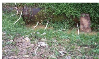
Flagrante de ligações clandestinas em adutora

Na figura a seguir, pode ser observado o furto de água tratada através de ligações clandestinas precárias; fato comum em nossa rede de distribuição e adutoras que comprometem a qualidade da água dos cidadãos que mantêm seu abastecimento regularizado.