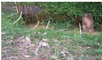
Flagrante de ligações clandestinas em adutora

Na figura a seguir, pode ser observado o furto de água tratada através de ligações clandestinas precárias; fato comum em nossa rede de distribuição e adutoras que comprometem a qualidade da água dos cidadãos que mantêm seu abastecimento regularizado.