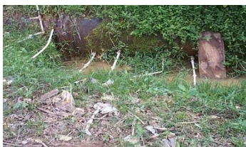
Flagrante de ligações clandestinas em adutora

Na figura a seguir, pode ser observado o furto de água tratada através de ligações clandestinas precárias; fato comum em nossa rede de distribuição e adutoras que comprometem a qualidade da água dos cidadãos que mantêm seu abastecimento regularizado.